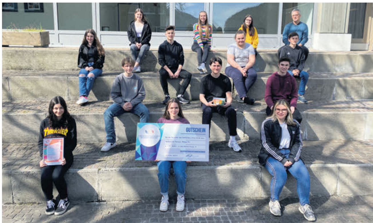
Die Schülerinnen und Schüler der 4b der Realschule Balzers konnten das Finale für sich entscheiden.

Im Rahmen der European Money Week – dabei handelt es sich um eine Initiative des Europäischen Bankenverbandes (European Banking Federation, EBF) – nahmen 13 Schulklassen aus Liechtenstein zeitgleich via Teams am gestrigen Länderfinale des European Money Quiz (EMQ) teil. Das EMQ ist für Schulklassen aller Schulformen in ganz Europa konzipiert und richtet sich an Schüler im Alter von 13 bis 15 Jahren. Der Wettbewerb wird über die spielbasierte Lernplattform «Kahoot!» ausgetragen. Rund 182 Jugendliche aus Liechtenstein nahmen am internationalen Wettbewerb zur Verbesserung ihrer Finanzkompetenz teil. Die Klasse der 4b der Realschule Balzers konnte das Liechtenstein-Fi-