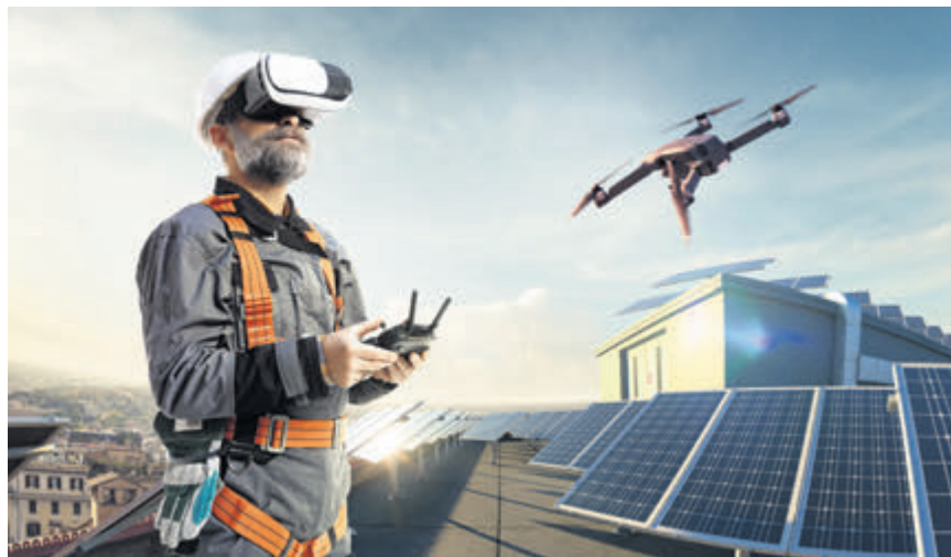
Künstliche Intelligenz für besseres Versicherungsmanagement.

Dabei richtet sich das Beyond-Insurance-Team stets nach konkreten Herausforderungen rund um versicherungsrelevante Risiken. Als Matchmaker zeigt Funk Unternehmen so technische Lösungen auf, die die Wert-